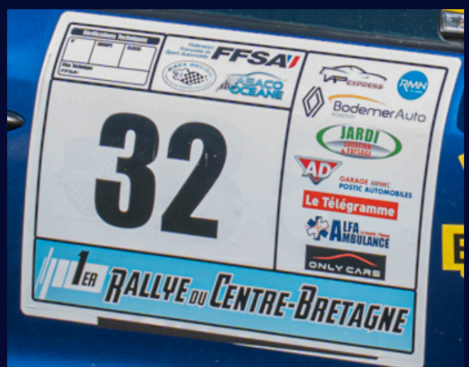
Exemple plaque portière