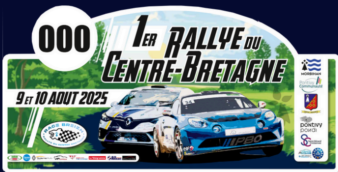
Exemple plaque Rallye